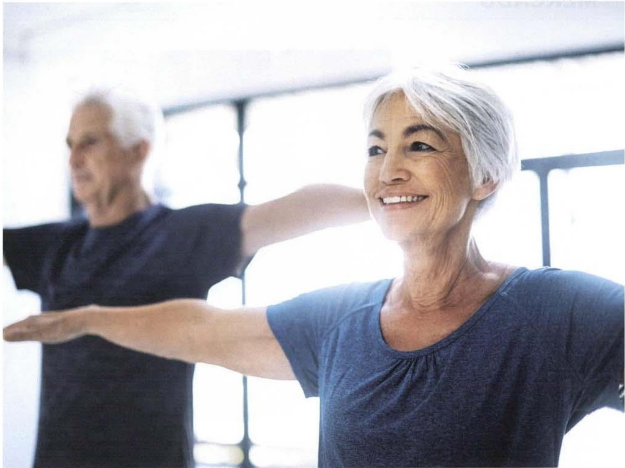
A população mais velha movimenta em torno de R$ 1,6 trilhão, o equivalente ao consumo de duas Holandas

“O fato é que o país está tão desorientado para lidar com o aumento da população idosa quanto as pessoas estão despreparadas para envelhecer. Esse forte componente cultural se reflete em vários segmentos da economia, não só na propaganda”. Para ele, enquanto o Brasil era um país jovem, a propaganda se acostumou a olhar para novos consumidores, entendendo que os mais velhos já conheciam marcas e já haviam atingido uma estabilidade na vida. “Mesmo assim, é preciso considerar o uso de ferramen-